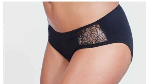
Entusia & Charco